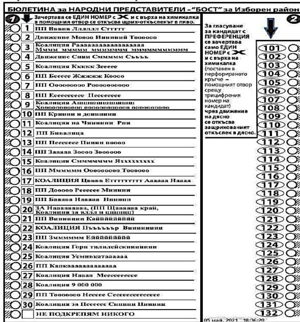
Фигура 2. Бюлетина БОСТ 2021 във формат А4. ( http://www.slance.eu/ballotBOST-A4.jpg )